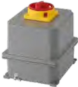
Size, grandezza: S3-HC ATEX